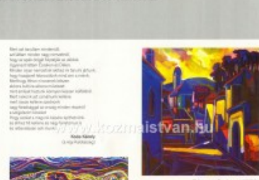
Székely László Székely (1991) olaj-vaszn, 90 x 70