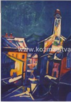
Ragyogó fél éjszaka (1967) olaj-vaszn, 100 x 85