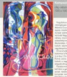
Közös kiállítás (1991) olaj-vaszn, 100 x 100