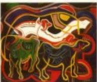
Béla Gál (1981) olaj-vászon, 70 x 60