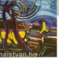
Venezia (1970) olaj-vászon, 83 x 53