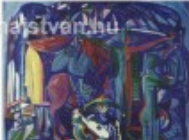
Béla Gál Béla Gál (1931) olaj-vászon, 100 x 110

Amikor valaki egy kiállítást látogat meg, az először azt vizsgálja, hogy a művész milyen módon kívánja megmutatni a világot, és milyen módon kívánja megmutatni magát. A kiállítások általában két fő csoportba oszthatók: a figurális és az absztrakt. A figurális művészet a világot úgy ábrázolja, ahogy azt látjuk, és az absztrakt művészet a világot úgy ábrázolja, ahogy azt érezzük. A kiállítások általában két fő csoportba oszthatók: a figurális és az absztrakt. A figurális művészet a világot úgy ábrázolja, ahogy azt látjuk, és az absztrakt művészet a világot úgy ábrázolja, ahogy azt érezzük.