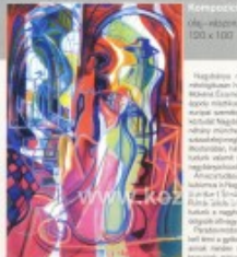
Kempesok (1991) olaj-vászon, 100 x 100