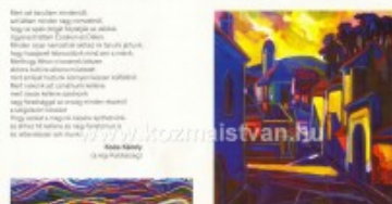
Béla Gál (1970) olaj-vászon, 80 x 70